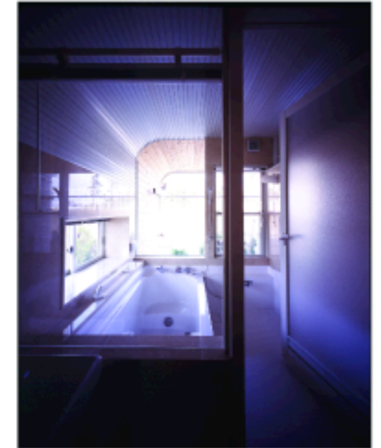
A: 水回りにも露出した構造

西側外部には大型のルーバー門扉をとりつけた。昼間はルーバー自らが太陽光によって影をつくり、外部からの目隠しとして機能する。夜は逆に内部からもれる光によって印象的なファサードをつくりあげている。 田舎の、広すぎる故に心許ない敷地の中で、強く確かな存在感をもって自立するシェルターができあがった。